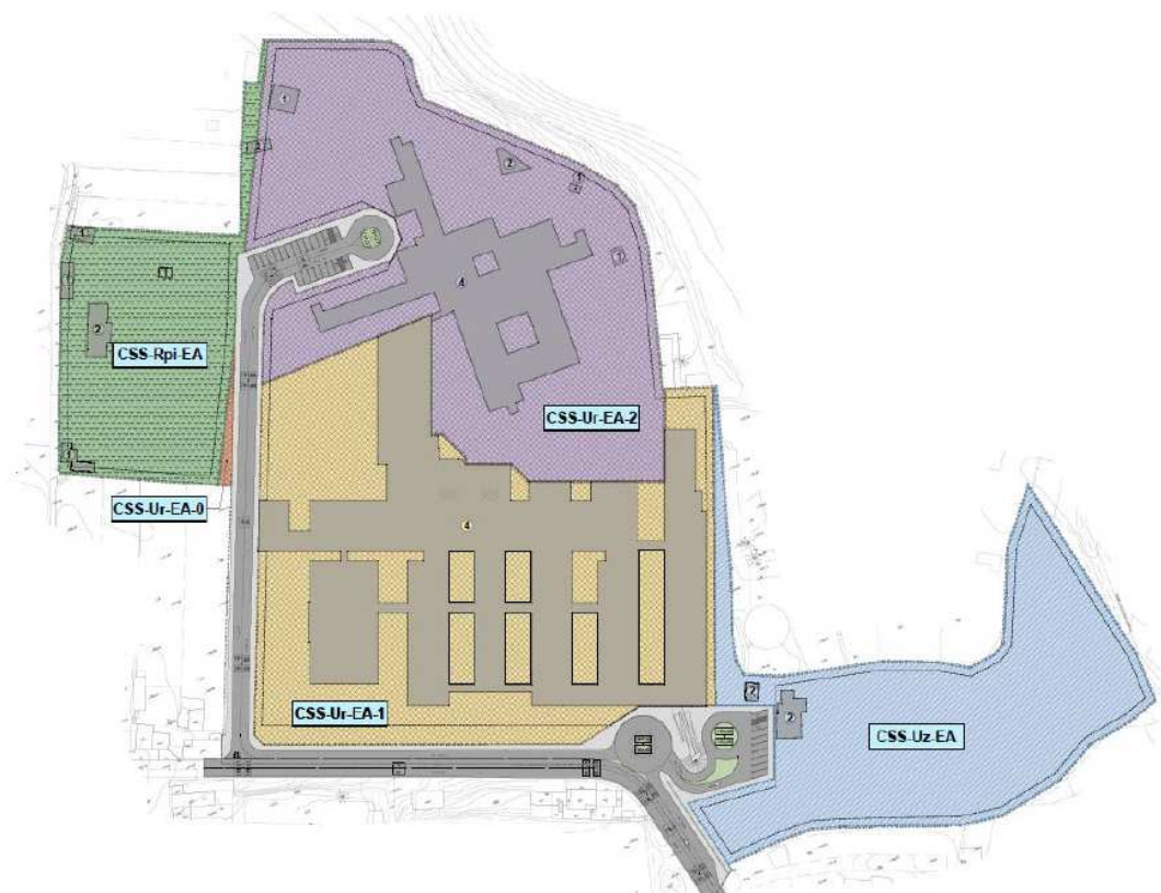
Imagen 3: Zonificación Alternativa 3 y 4.

La edificabilidad neta total será de 54.288,44 m 2 para poder permitir ampliar las instalaciones de acuerdo con las necesidades con un edificio para cocina, centro de instalaciones, edificio para suministro de gases medicinales y ampliación de la actual Residencia de Pensionistas, así como el resto de las demandas que puedan surgir a futuro en