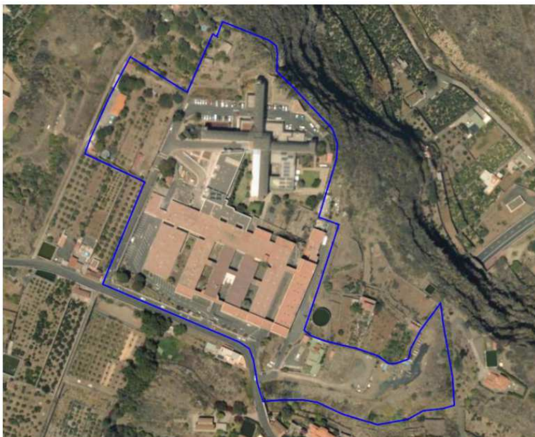
Imagen 1: Ortofoto del ámbito de estudio.

Las parcelas afectadas son: 9374502BS2797S0001YI, 9374501BS2797S0001BI, 38037A004000200000SW y 38037A004002740000SH, siendo la superficie total del conjunto 53.422,07 m 2 y con una superficie construida de 30.966,39 m 2 .